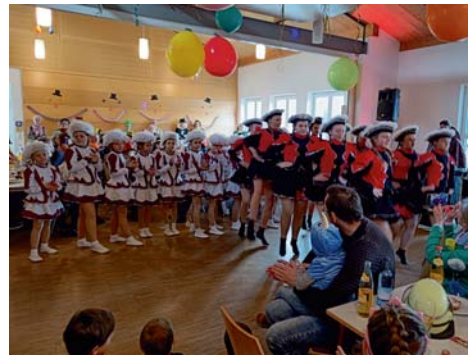
Kinder- und Jugendgarde des SV Zwiesel