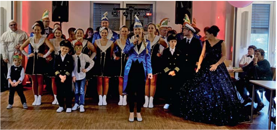
Die Fidelity ist beim Kehraus zu Besuch