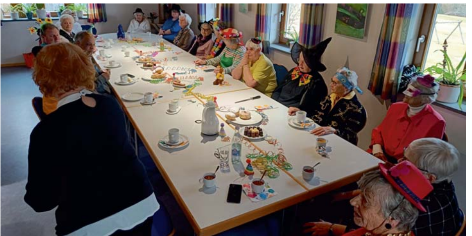
Fasching der Ludwigsthaler Herbstasterl