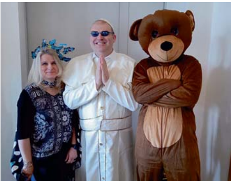
Der Papst kommt Fasching zu Besuch