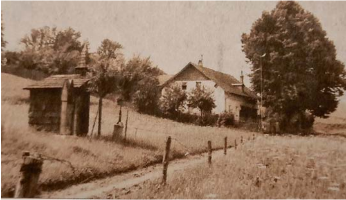
Die Kapelle an ihrem ursprünglichen Standort Foto: Paul Friedl 1955

Das Ensemble wurde seit seiner Erbauung zweimal verlegt und befindet sich seit 1971 an seinem aktuellen Standort.